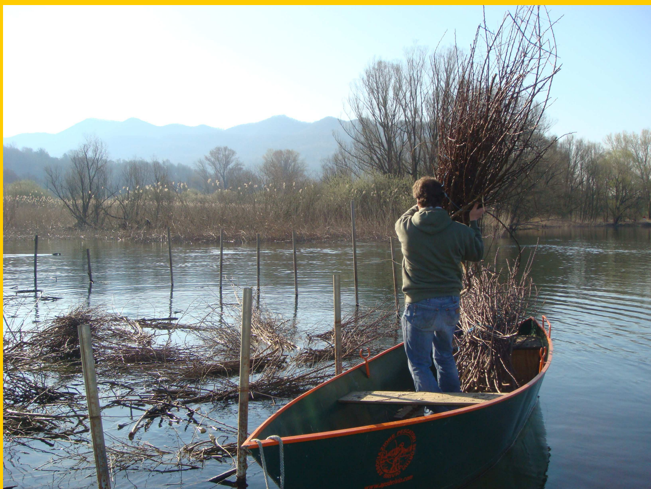
Scene di vita briviese: l'antica tradizione dei legné.