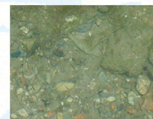
AVANOTTI IN PROSSIMITA' DI LEGNAIE

LE LEGNAIE SONO FORMATE DA UN RECINTO DI PALI E FILO DI FERRO NEL QUALE VENGONO COLLOCATE DELLE FASCINE DI LEGNO ZAVORRATE CON BLOCCHI DI CEMENTO.