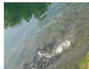
MOMENTO DELLA RIPRODUZIONE

I GEROLI SONO REALIZZATI CON GHIAIA DI DIMENSIONE 3/4 CM E CONSENTONO AI PESCI LA DEPOSIZIONE E LA FECONDAZIONE DELLE UOVA, LA SCHIUSA DELLE UOVA AVVIENE CIRCA 7 GIORNI DOPO LA DEPOSIZIONE SUI GEROLI.