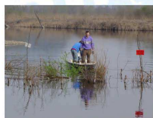
FASE DI REALIZZAZIONE