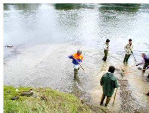
FASE DI REALIZZAZIONE