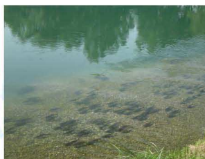
ASSEMBRAMENTO DI PESCI