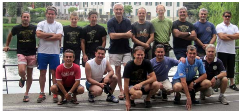
Alcuni dei sub e organizzatori

Bottiglie, piatti e vasi in ceramica, pneumatici, tegole, tubi in ferro, sdraio prendisole, un braccio meccanico motore e una batteria per auto, un "completo" bagno con water e lavabo. È una vera e propria "discarica" quella che è stata portata a galla dal fondale dell'Adda a Brivio nella mattinata di domenica 8 luglio, grazie all'iniziativa promossa da Pro Loco, Geb, Associazione Pescatori Sportivi, Mato Grosso con l'aiuto di altri volontari e l'appoggio dell'amministrazione comunale.